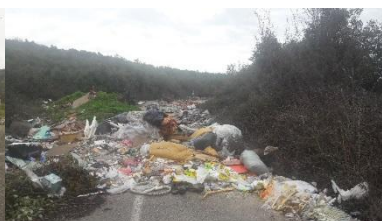
Područje Umac – Vrana