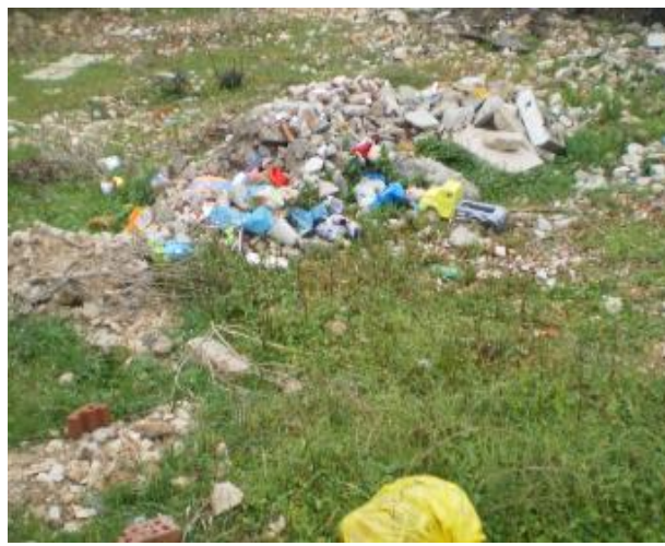
Slika 4: Uz magistralu Pakoštane-Drage