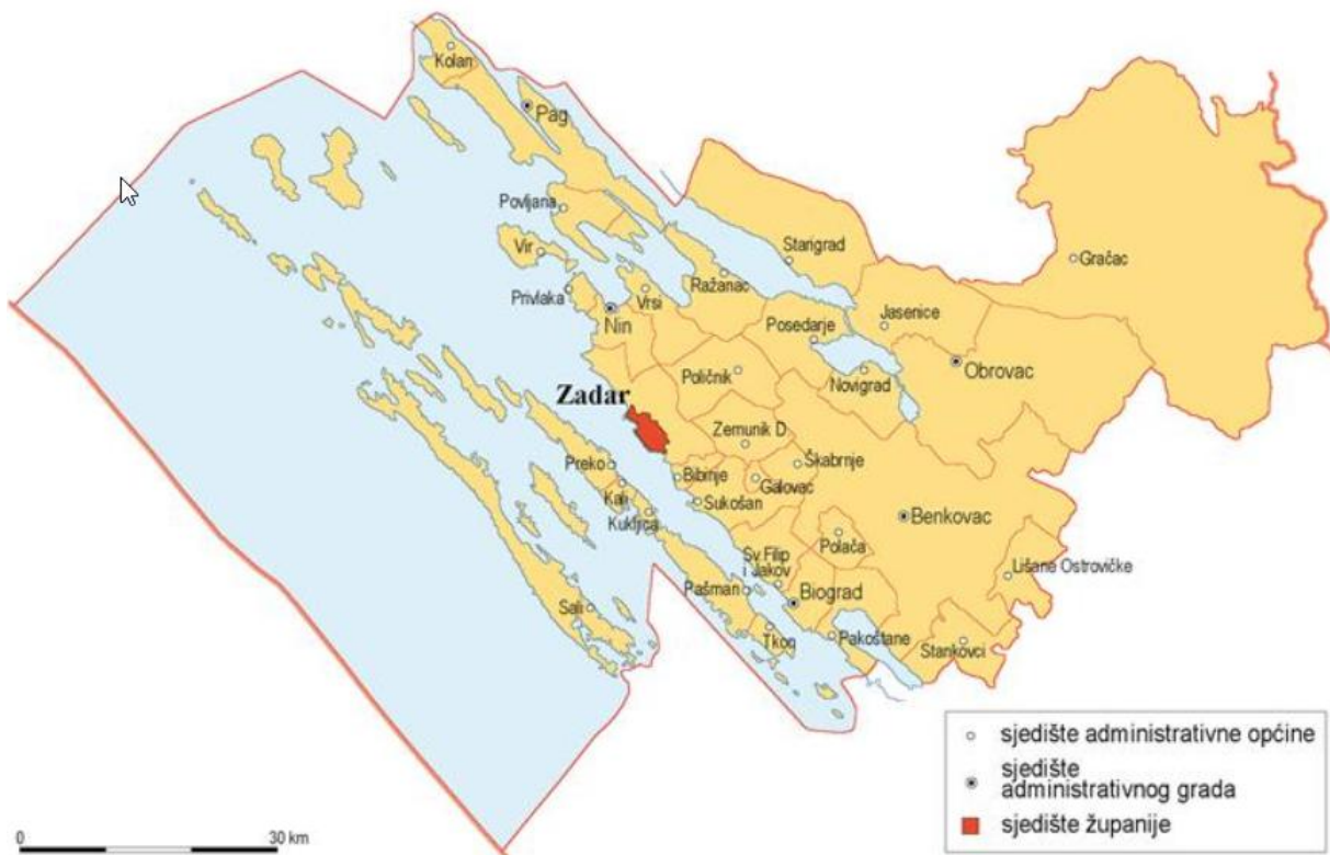
Slika 1: Položaj Općine Pakoštane unutar Zadarske županije