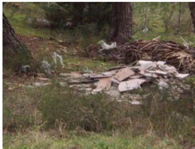
Slika 8: Park prirode Vransko jezero, lok. 3

Općina redovito provodi sustavnu sanaciju divljih odlagališta otpada i nadzor lokacija na kojima je uočeno povremeno nelegalno odlaganje otpada u svrhu sprječavanja nastajanja novih divljih odlagališta otpada.