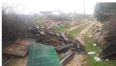
Područje uz Vransko jezero