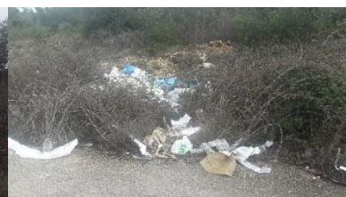
Pakoštane-Drage (Lukina draga)