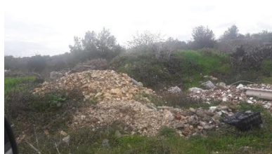
Područje uz Vransko jezero Pakoštane-Drage