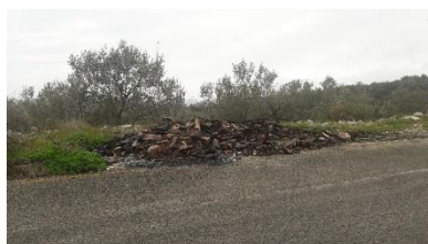
Pakoštane-Drage (Lukina draga)