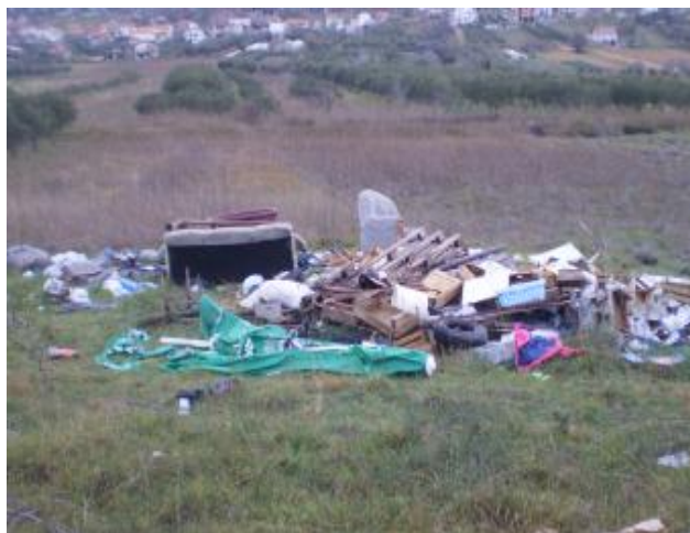
Slika 5: Naselje Vrana