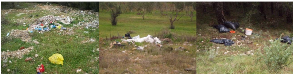
Vransko jezero: Pakoštane-Drage Vransko jezero: Pakoštane-Drage Vransko jezero: Pakoštane-Drage