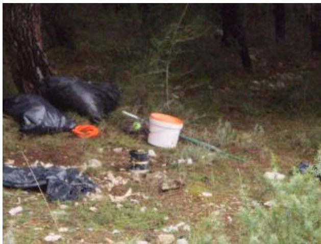
Slika 7: Park prirode Vransko jezero, lok. 2