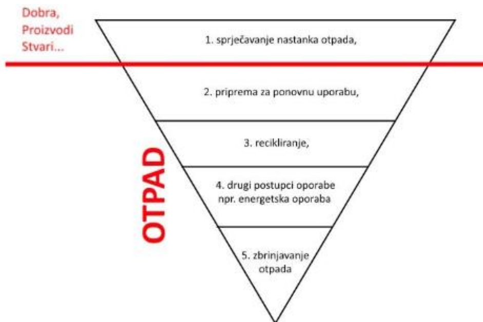
Slika 9: Red prvenstva gospodarenja otpadom

Takav sustav daje naglasak na ponovno korištenje, popravak, obnavljanje i recikliranje postojećih materijala i proizvoda.