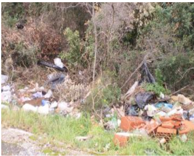
Slika 3: Lukina Draga u naselju Drage

Na području Općine evidentirano je 6 manjih odlagališta otpada , svako oko 20 m 2 , koja će biti sanirana kroz kraći vremenski period, a nalaze se u šumskim područjima Općine i unutar Parka prirode Vransko jezero: