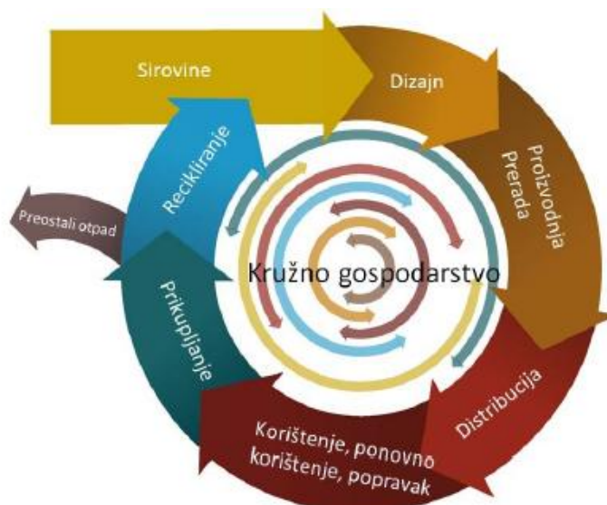
Slika 10: Red prvenstva gospodarenja otpadom

Jedan je od osnovnih ciljeva EU, kroz čitav niz financijskih instrumenata i strategija, potaknuti unaprjeđenje gospodarskog sustava u smislu učinkovitijeg korištenja resursa i energije. Desetogodišnja razvojna strategija Europa 2020. (Europska strategija za pametan, održiv i uključiv rast) kao jedan od osnovna tri prioriteta razvoja EU predlaže održivi rast, tj. promicanje ekonomije koja učinkovitije iskorištava resurse, koja je zelenija i konkurentnija. Središnji aspekt ove strategije je prelazak s postojećeg, linearnog, na kružno gospodarstvo , ekonomski model koji osigurava održivo gospodarenje resursima i produžavanje životnog vijeka materijala i proizvoda. Cilj ovog modela je svesti nastajanje otpada na najmanju moguću mjeru, i to ne samo otpada koji nastaje u proizvodnim procesima, već sustavno, tijekom čitavog životnog ciklusa proizvoda i njegovih komponenti.