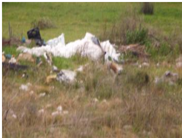
Slika 6: Park prirode Vransko jezero, lok.