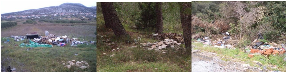
Područje Vrana: Zelići