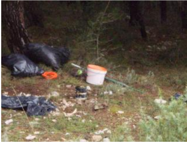
Slika 7: Park prirode Vransko jezero, lok. 2