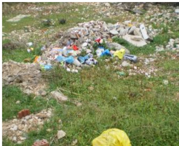
Slika 4: Uz magistralu Pakoštane-Drage