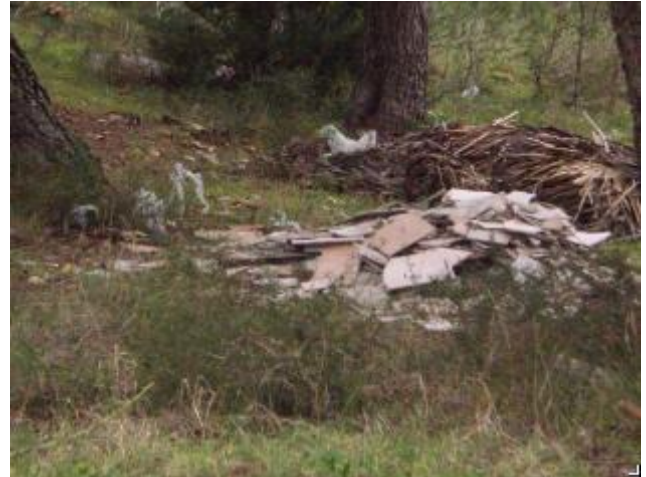
Slika 8: Park prirode Vransko jezero, lok. 3

Općina redovito provodi sustavnu sanaciju divljih odlagališta otpada i nadzor lokacija na kojima je uočeno povremeno nelegalno odlaganje otpada u svrhu sprječavanja nastajanja novih divljih odlagališta otpada.