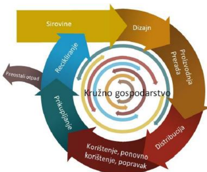
Slika 10: Red prvenstva gospodarenja otpadom

Jedan je od osnovnih ciljeva EU, kroz čitav niz financijskih instrumenata i strategija, potaknuti unaprjeđenje gospodarskog sustava u smislu učinkovitijeg korištenja resursa i energije. Desetogodišnja razvojna strategija Europa 2020. (Europska strategija za pametan, održiv i uključiv rast) kao jedan od osnovna tri prioriteta razvoja EU predlaže održivi rast, tj. promicanje ekonomije koja učinkovitije iskorištava resurse, koja je zelenija i konkurentnija. Središnji aspekt ove strategije je prelazak s postojećeg, linearnog, na kružno gospodarstvo , ekonomski model koji osigurava održivo gospodarenje resursima i produžavanje životnog vijeka materijala i proizvoda. Cilj ovog modela je svesti nastajanje otpada na najmanju moguću mjeru, i to ne samo otpada koji nastaje u proizvodnim procesima, već sustavno, tijekom čitavog životnog ciklusa proizvoda i njegovih komponenti.